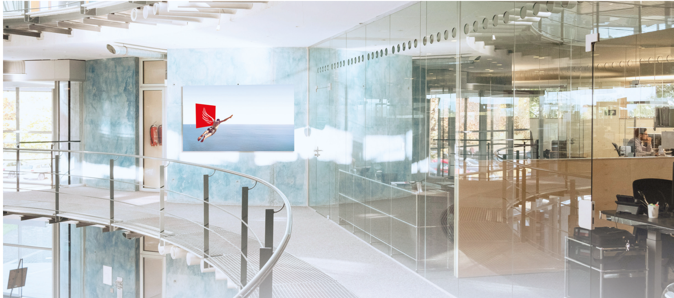
Innenräume der DATAGROUP-Unternehmenszentrale Pliezhausen