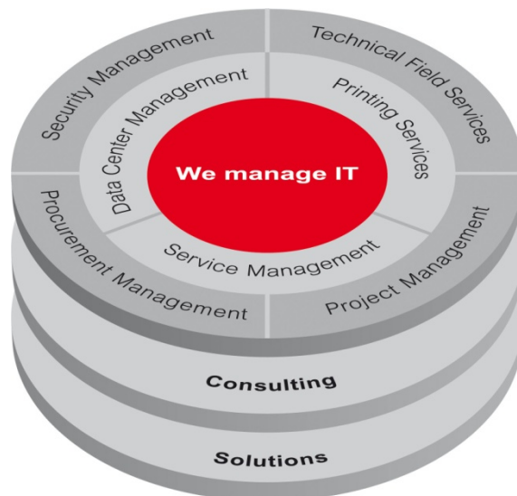
Geschäftsfelder der DATAGROUP

Die Geschäftsfelder des DATAGROUP-Konzerns lassen sich in drei Bereiche unterteilen: IT-Services, Consulting und Solutions.